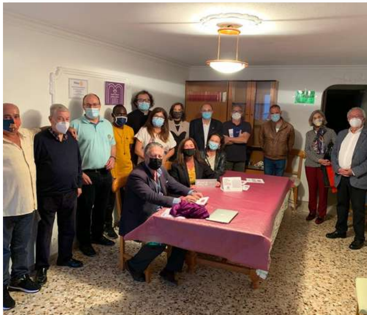
Casita Pedro Arrupe d'Alacant