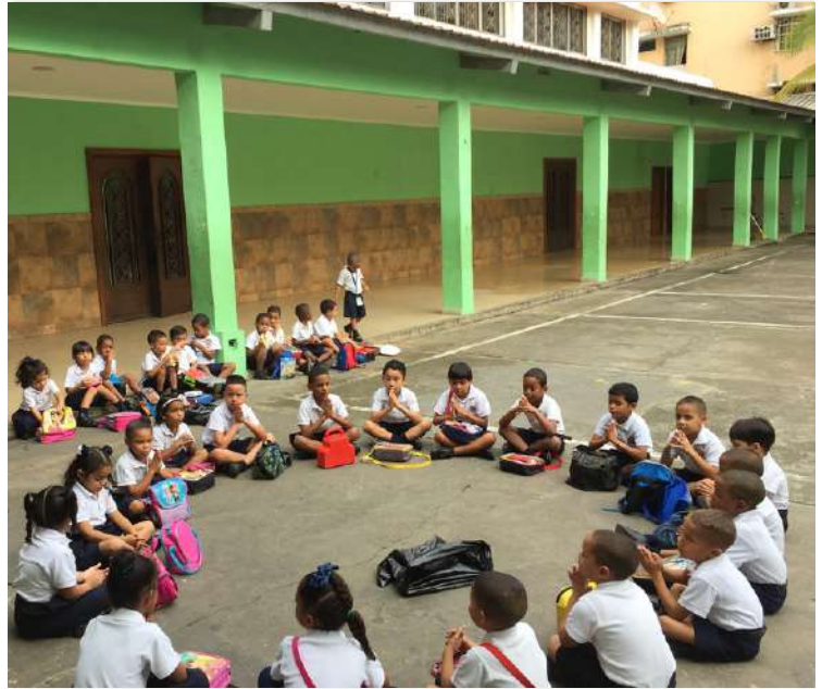
Escola la Merced, Panamà