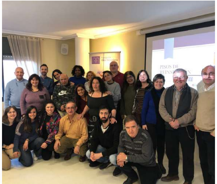
Part de l'equip professional i voluntaris