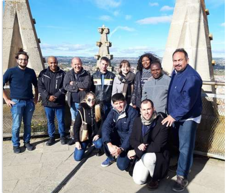
Sortida taller amb els usuaris i l'equip de Lleida