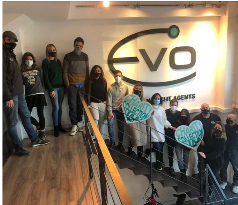
Evo, empresa donant

En diferents comunitats mercedàries es va realitzar la Campanya de Nadal " temps d'acollir, temps de Mercè " a favor dels pisos d'acolliment d'Obra Mercedària. Entre les diferents Parròquies que es van sumar a la iniciativa (la Mercè de Lleida, la Mercè de Palma de Mallorca, Sant Pedro Nolasco, Verge de Natzarret, Basílica de la Mercè, Hnas. Mercedàries) hem sumat un total de 7.122'91€ Gràcies a tots!