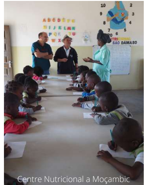
Centre Nutricional a Moçambic

En aquest any 2.020 hem intervingut en les comunitats més desfavorides, Veneçuela, Guatemala, Panamà, El Salvador, Moçambic , encara que arran del Covid, s'han deixat de repartir queviures en algunes comunitats durant la pandèmia.