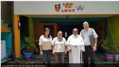
La pandemia de la trata de personas

“Hoy existen esclavos, hombres, mujeres y niños(as) viven en carne propia el ser crucificados, son historias de vida desgarradas por el egoísmo, el odio, por una cultura de la muerte que rinde culto a la explotación y a un mercantilismo salvaje”