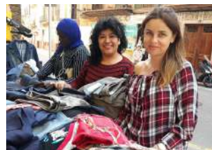
Mercadillo en Mallorca

En Castellón se realizó la Campaña solidaria de Navidad "libertad con dignidad" para ayudar a los pisos de acogida para presos.