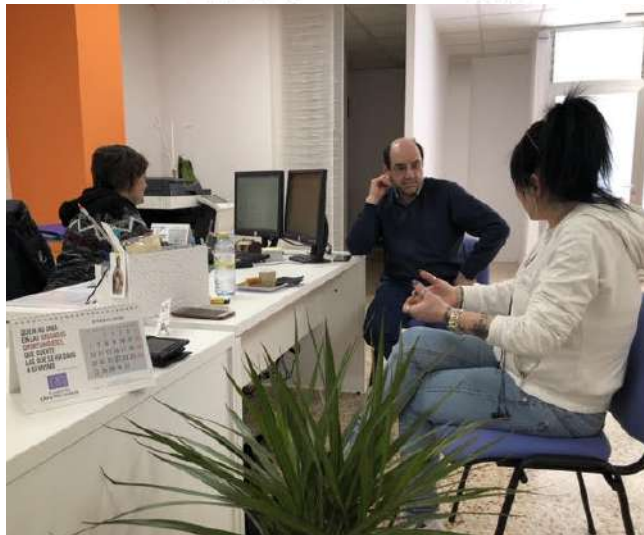
Asesoramiento en el Punto Libertad de Castellón

LUNES MARTES MIÉRCOLES JUEVES VIERNES SÁBADO DOMINGO