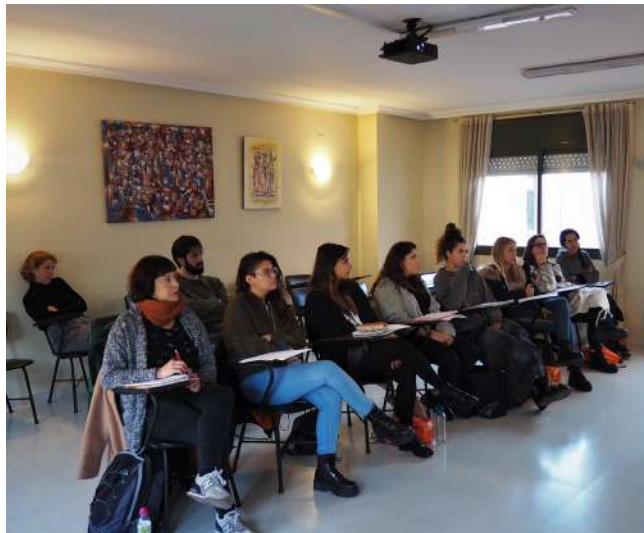
Formación de voluntarios de Obra Mercedaria de Barcelona

LUNES MARTES MIÉRCOLES JUEVES VIERNES SÁBADO DOMINGO