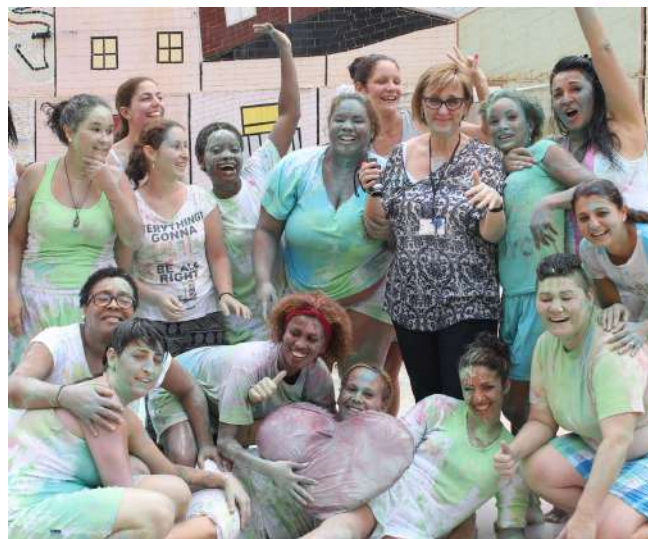
Internas del Centro de Mujeres Wad-Ras de Barcelona

LUNES MARTES MIÉRCOLES JUEVES VIERNES SÁBADO DOMINGO