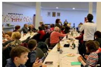
Comida en Elche

LUNES MARTES MIÉRCOLES JUEVES VIERNES SÁBADO DOMINGO