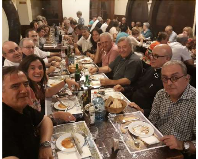
Cena Solidaria en Palma de Mallorca

LUNES MARTES MIÉRCOLES JUEVES VIERNES SÁBADO DOMINGO