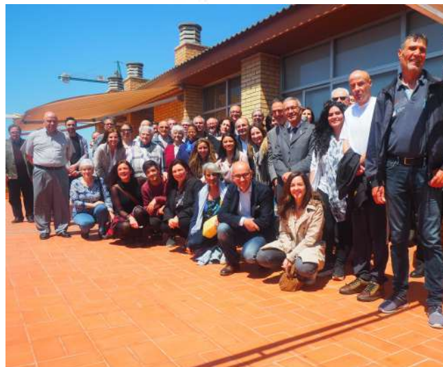
Inauguración de la 2ª planta de la Llar La Mercè de Sant Feliu

LUNES MARTES MIÉRCOLES JUEVES VIERNES SÁBADO DOMINGO