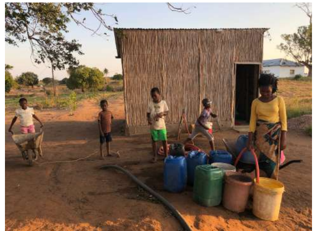
Niños recogiendo agua en XaiXai