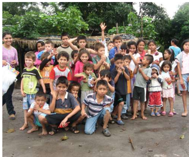
Niños apadrinados de El Salvador

LUNES MARTES MIÉRCOLES JUEVES VIERNES SÁBADO DOMINGO