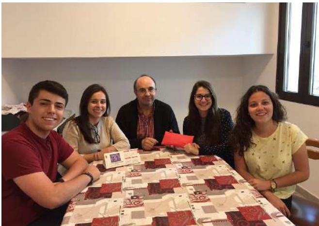
Donación de los jóvenes de Castellón