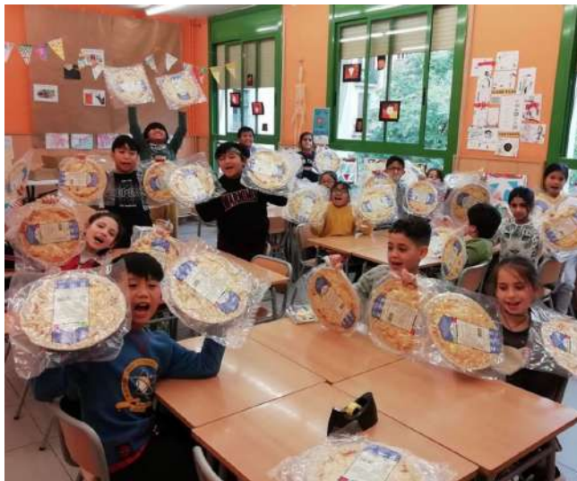
Entrega de pizzas en la Escuela CEIP Castella del Raval

LLUNES MARTES MIÉRCOLES JUEVES VIERNES SÁBADO DOMINGO