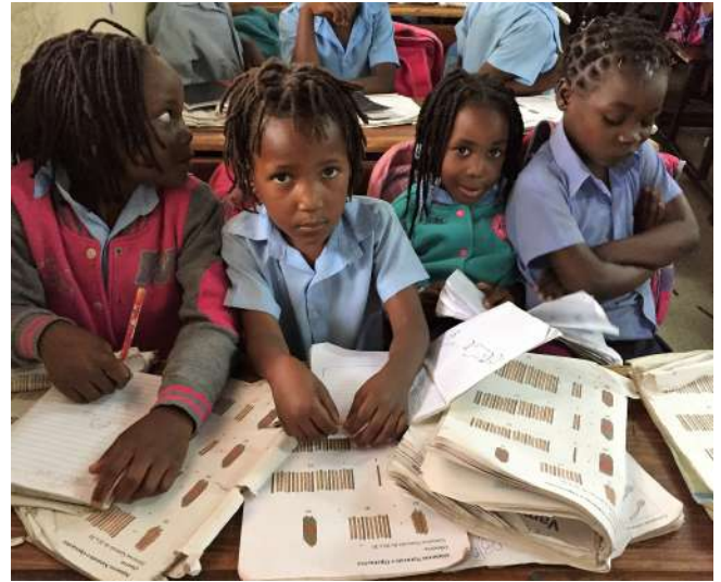
Escuela Nossa Senhora do Livramento de Mozambique

LUNES MARTES MIÉRCOLES JUEVES VIERNES SÁBADO DOMINGO