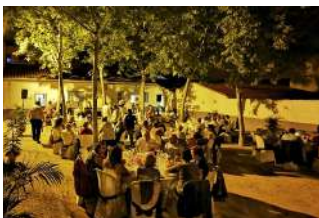
Cena en Zaragoza

Un grupo de la parroquia San Vicente Ferrer de Elche de Manos Unidas organizó una comida solidaria con más de 100 personas a beneficio de la Fundación Obra Mercedaria.