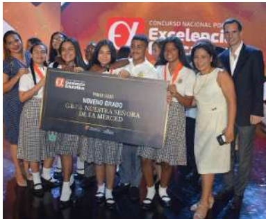
Excelencia Educativa, Panamá

El Colegio Nuestra Señora de la Merced ganó el Concurso por la Excelencia Educativa 2019 . Veintidós centros educativos del país se disputaron el Concurso Nacional por la Excelencia Educativa 2019,