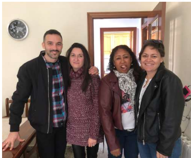
Piso Mujeres Lires de Castellón

LUNES MARTES MIÉRCOLES JUEVES VIERNES SÁBADO DOMINGO