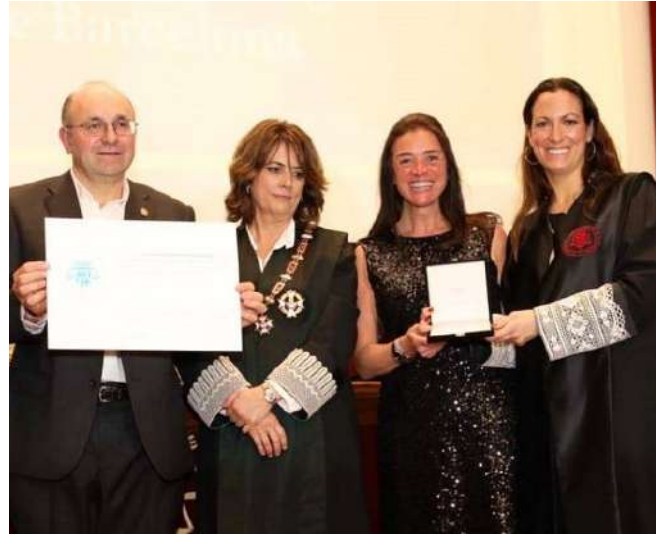
Reconocimiento del Ilustre Colegio de Abogados de Barcelona

LUNES MARTES MIÉRCOLES JUEVES VIERNES SÁBADO DOMINGO