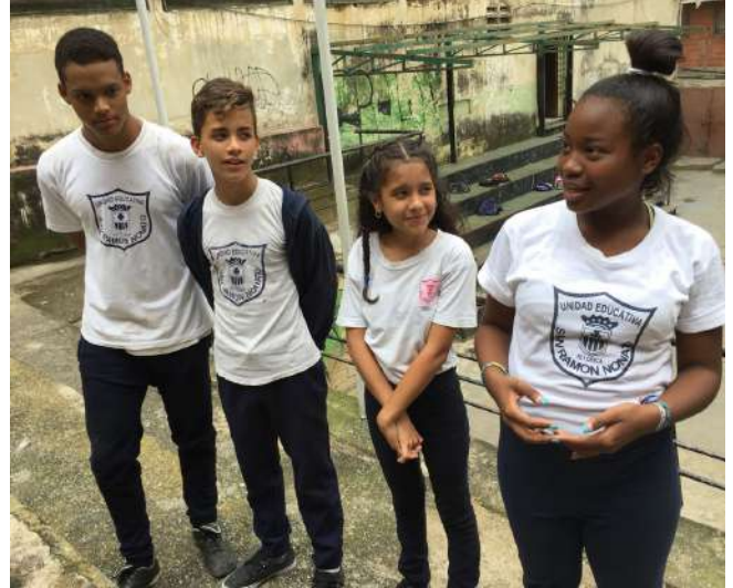
Alumnos del Colegio San Ramón Nonato de Catia, Venezuela

LUNES MARTES MIÉRCOLES JUEVES VIERNES SÁBADO DOMINGO