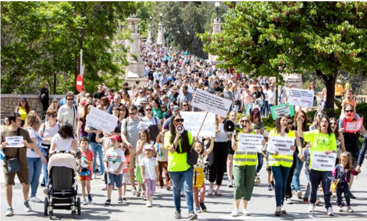
MOVILIZACIÓN. Los participantes en la manifestación, que llevaban carteles y coreaban consignas, cruzan el Viaducto para dirigirse a la Glorieta. Javier Escriche