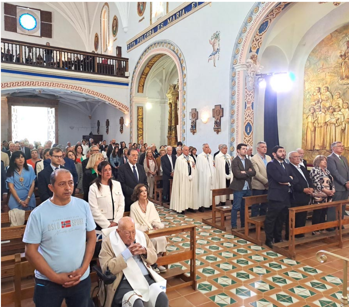
Eucaristía en la iglesia de Nuestra Señora del Olivar, con autoridades y otros integrantes de la asociación. M. N.