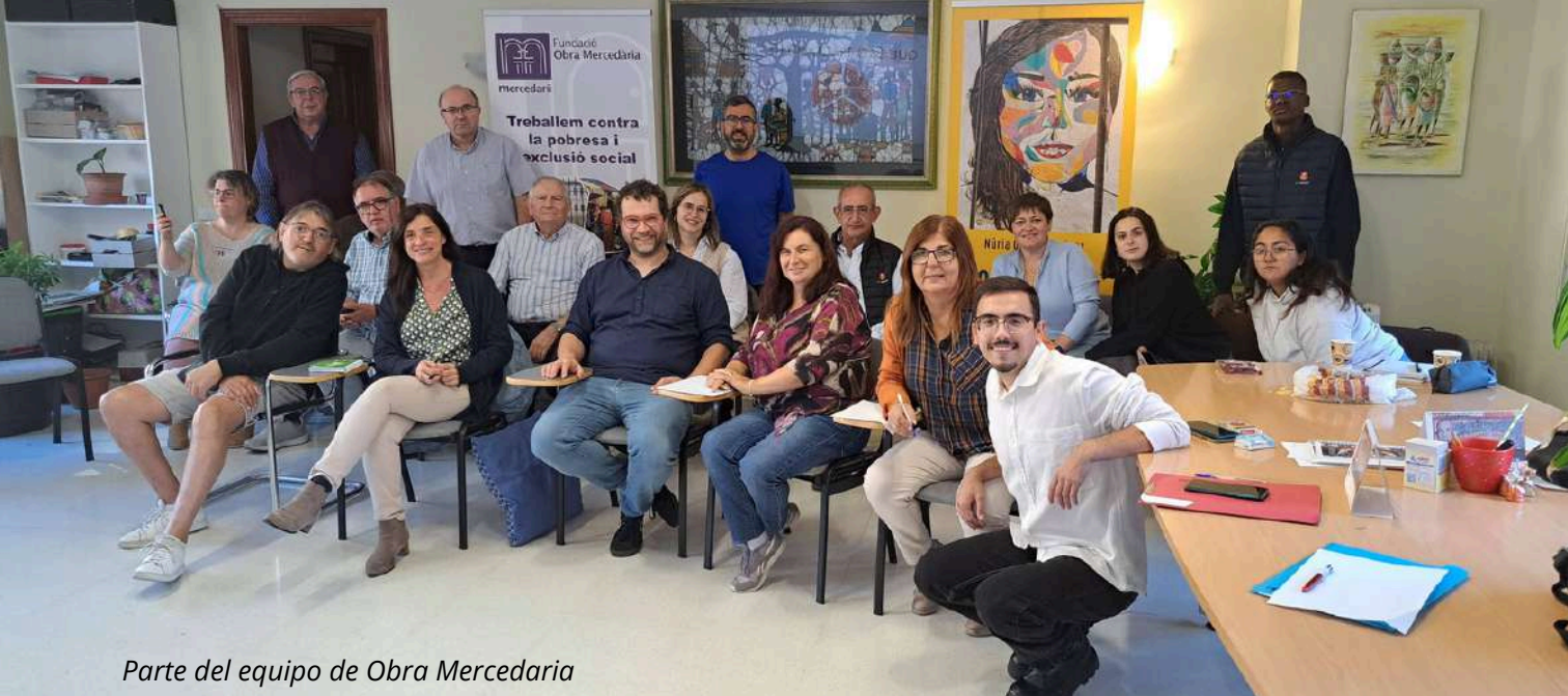
Parte del equipo de Obra Mercedaria