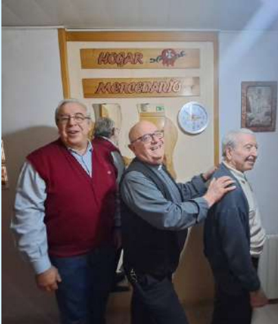
Hogar Mercedario de Barcelona

Cuando una persona está dentro de un centro penitenciario no puede salir de permiso o tercer grado sin una dirección postal donde ir. Los Hogares Mercedarios son una respuesta para quien no disfruta de libertad o finaliza su condena sin red familiar, económica o social.