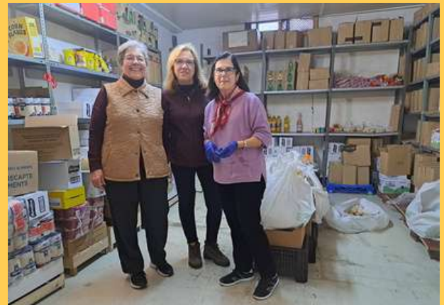
Voluntarias del BdA, Barcelona