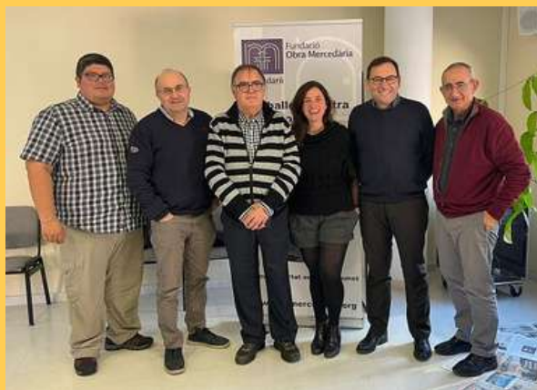
El Gobierno Provincial con la directora