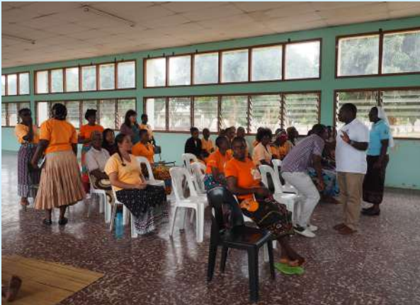
Centro Penitenciario de Mujeres, Maputo

Creamos una sociedad más justa, que no de la espalda a la realidad penitenciaria y que se implique en su proceso de reinserción, para que cada persona pueda vivir libremente, con dignidad y lejos de las nuevas esclavitudes.