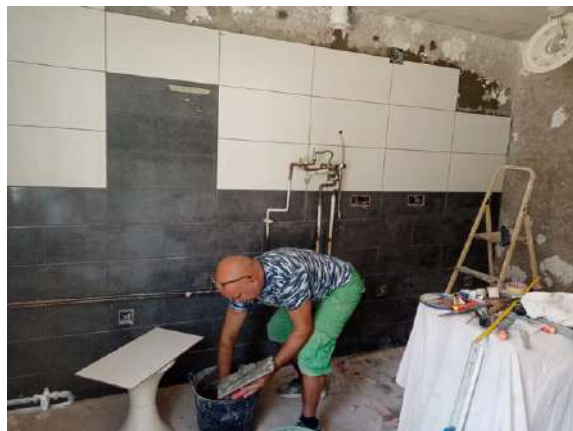
Cambio de cocina gracias a los Amigos de la Merced

También han sido importantes las colaboraciones en producto que hemos recibido de empresas que nos han permitido desarrollar nuestros proyectos.