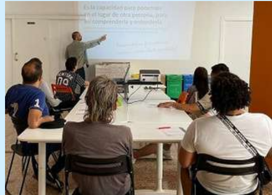
Taller Convivir, Castellón