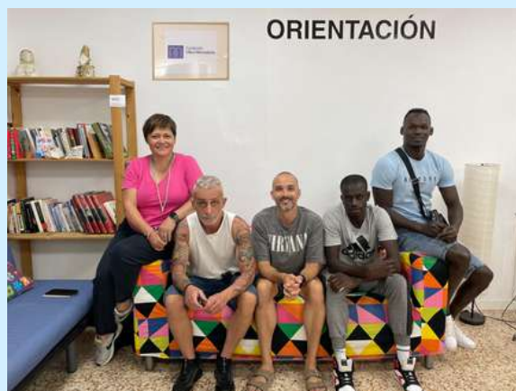
Punto Libertad Castellón

Actualmente damos servicio en el PAO Barcelona, PAO Elche, PAO Lleida y Punto Libertad Castellón, atendiendo a usuarios y familias necesitadas.