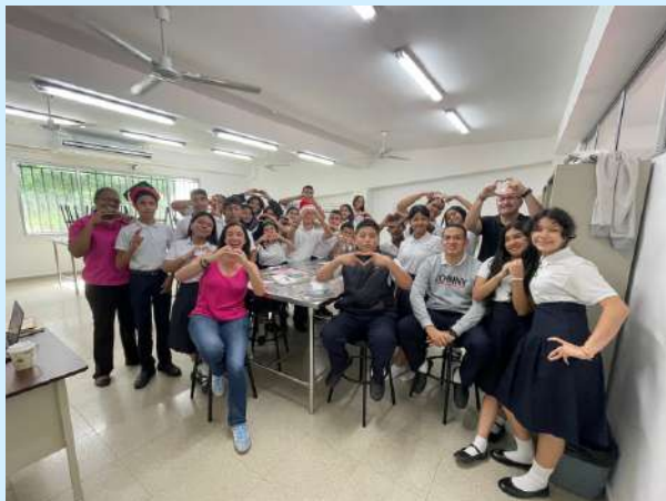
C.F.I. Ntra. Sra de la Merced, El Chorrillo, Panamá