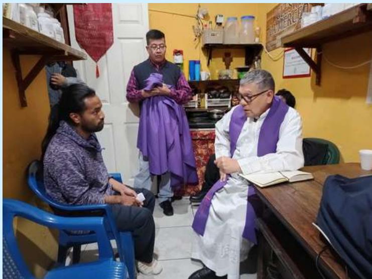
Centro Penitenciario Pavoncito, Guatemala

Así mismo regentamos las capellanías en algunos de los centros penitenciarios de Panamá, Guatemala, El Salvador, Venezuela y Mozambique , atendiendo un total de 34 centros penitenciarios en tres continentes: Europa, África y América.