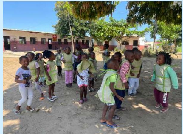
Centro Nutricional San Damaso, Mozambique