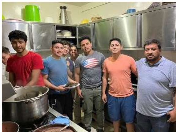
Residencia Universitaria Cristo Redentor, El Salvador

También han sido importantes las colaboraciones en producto que hemos recibido de empresas que nos han permitido desarrollar nuestros proyectos.