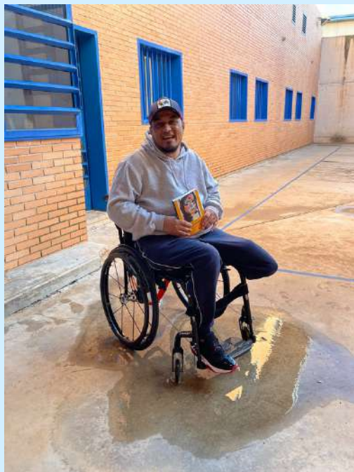
Centro Penitenciario Mallorca

Acompañamos a las personas privadas de libertad dentro de las cárceles. Las apoyamos tanto a nivel religioso, espiritual y humano, como jurídico y material.