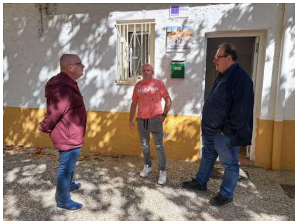
Hogar Mercedario de Zaragoza

La Fundación ha recibido ayudas económicas por parte del sector público, fundaciones, organizaciones, entidades bancarias, particulares y empresas para seguir trabajando y potenciando nuestra obra social.