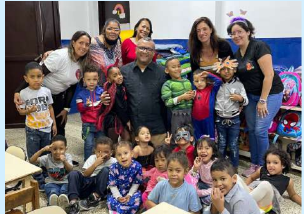
Colegio San Ramon Nonato, Caracas

Estamos al lado del preso en todo el proceso penitenciario: antes, durante y después de la condena. A través de las diferentes etapas -prevención, acompañamiento y reinserción-, queremos que la persona presa se sienta apoyada e integrada en la sociedad.