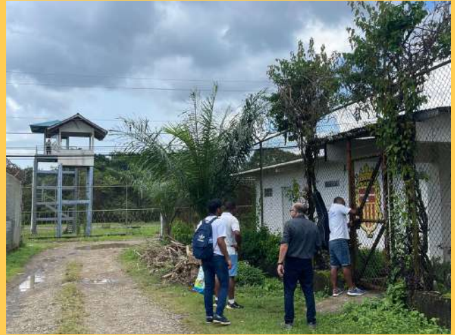
Centro Penitenciario La Joya, Panamá

La Fundación Obra Mercedaria se creó en el año 2006 con la intención de amparar y agrupar las acciones sociales de la Provincia Mercedaria de Aragón. La Orden de la Merced nació en Barcelona el año 1218 -siglo XIII-. Nuestras principales vías de actuación son dos: las personas privadas de libertad y la cooperación para el desarrollo en Mozambique, El Salvador, Guatemala, Panamá y Venezuela.