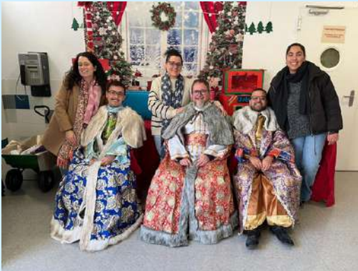
Módulo de Madres C.P. Fontcalent, Alicante

hogares de acogida Punto Atención Orientación (PAO) servicio jurídico orientación laboral talleres formativos